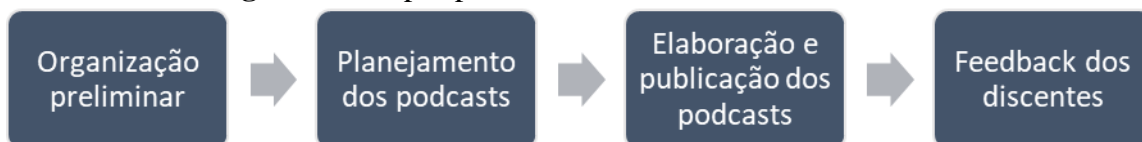
Figura 2 – Etapas para o desenvolvimento da atividade.

A metodologia educacional constitui-se nas etapas apresentadas na Figura 2.